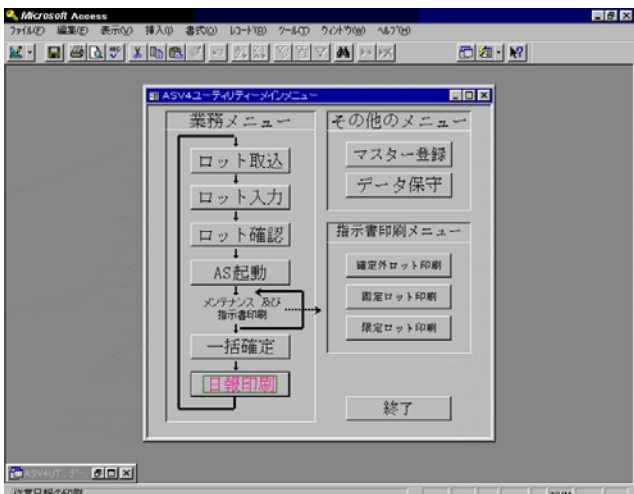
図3：独自でカスタマイズした ASPROVA ユーティリティ画面。現場の様々な要望を反映した機能が盛り込まれている。